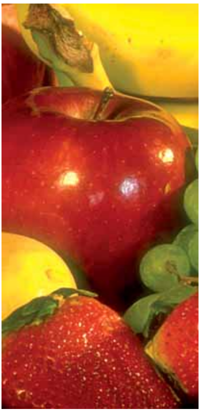
Eine sinnvolle Ergänzung der Bewegungspraxis liefern schließlich zwei theoretische Gruppensitzungen zum Thema Bewegung.

Neben verschiedenen Ausdauertrainingsarten (z.B. Nordic Walking) spielt das Thera-Band® in den praktischen Bewegungseinheiten eine zentrale Rolle. Mit dem so genannten „kleinsten Fitnessstudio der Welt“ erlernen die Teilnehmer gezielte Kräftigungsübungen, die die Muskulatur und damit den Bewegungsapparat langfristig stärken. Der Vorteil: Das Trainingsgerät kann überall hin mitgenommen werden. Übungen sind so beispielsweise auch am Arbeitsplatz (Stichwort: „aktive Pausen“) möglich.