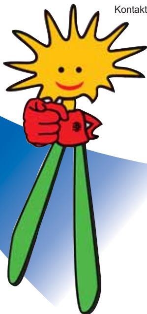
Jörn Rühl Redaktion Pluspunkt-Magazin